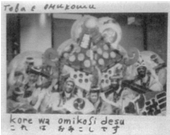
ブルガリア語と日本語の対照言語教育教材例 (ブルガリア語表記発音協力：スヴィレン先生)