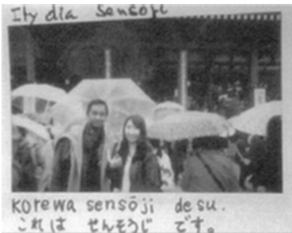
マダガスカル語と日本語の対照言語教育教材例 (マダガスカル語表記発音協力: アンツァ先生、マノエリナ先生)