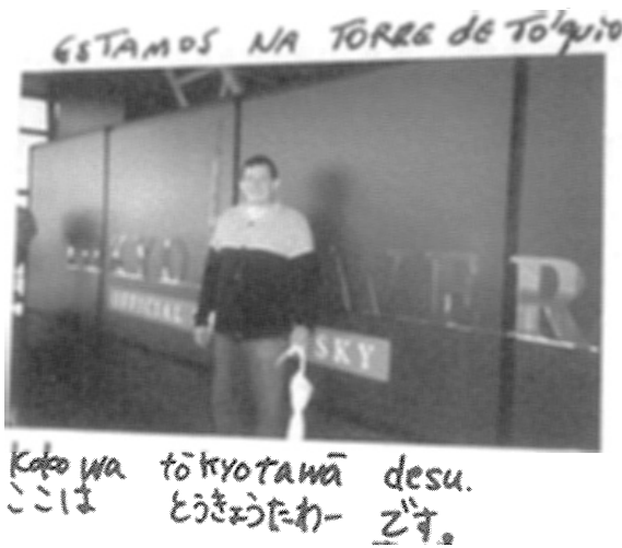
ポルトガル語と日本語の対照言語教育教材例 (ポルトガル語表記発音協力：オマール先生)