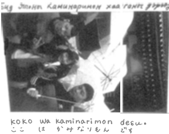
モンゴル語と日本語の対照言語教育教材例 (モンゴル語表記発音協力：チンバット先生、パッ デグリ先生)