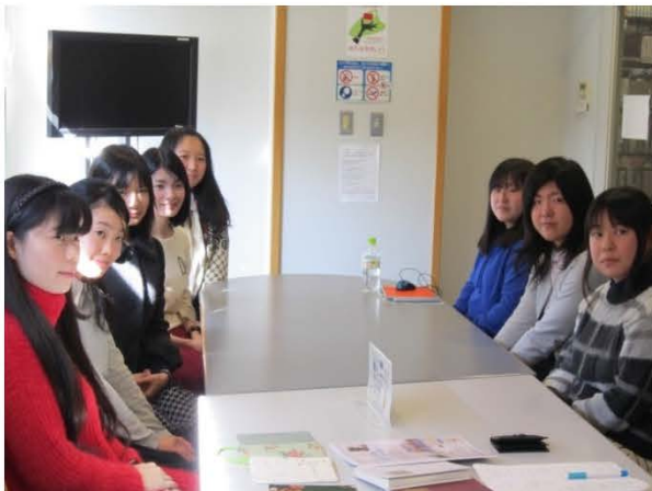
いつでも見学に来てください♥