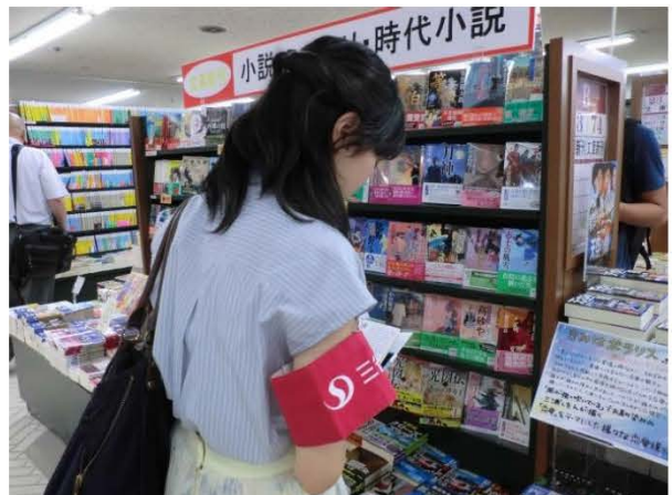
選書ツアーで大きな書店にも行けるよ！