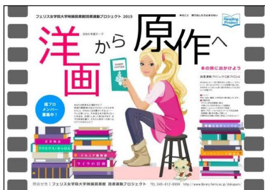
年間テーマポスター