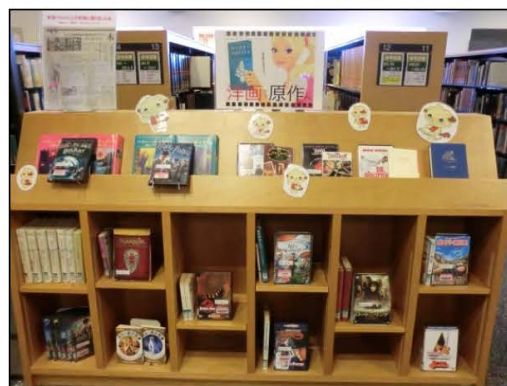
テーマ展示 「洋画から原作へ」