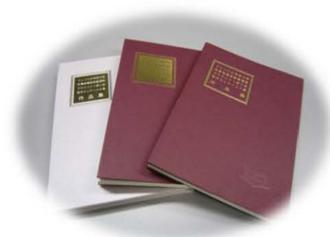
過去の創作コンクール作品集